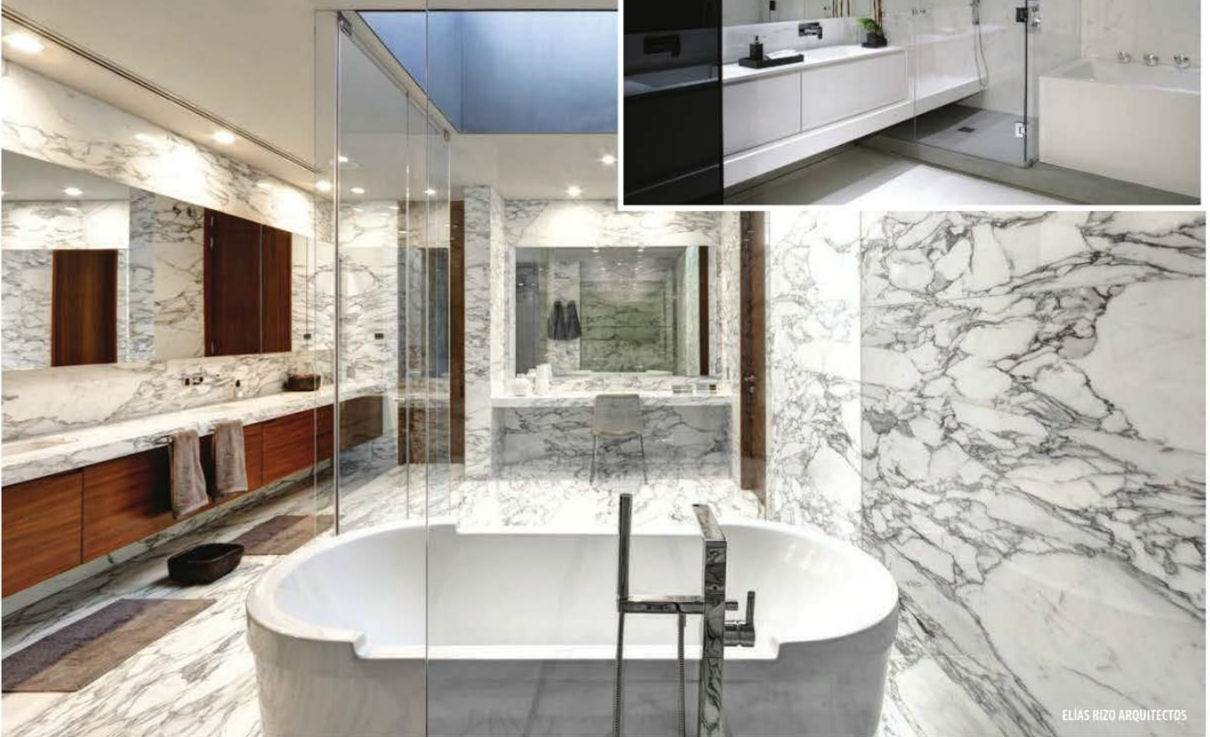
ELIAS RIZO ARQUITECTOS