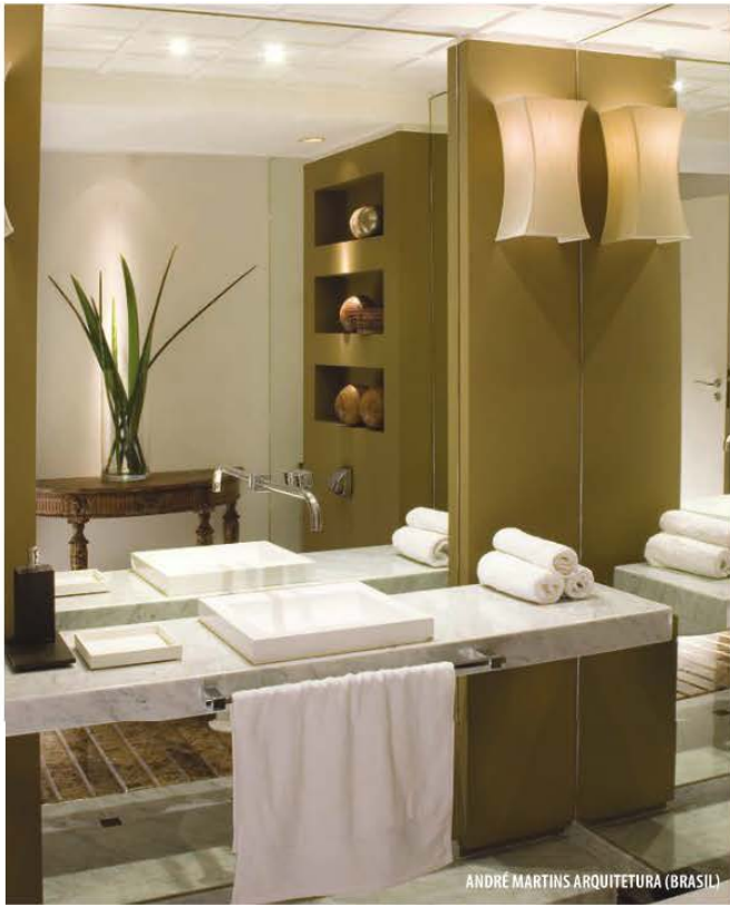
ANDRÉ MARTINS ARQUITETURA (BRASIL)