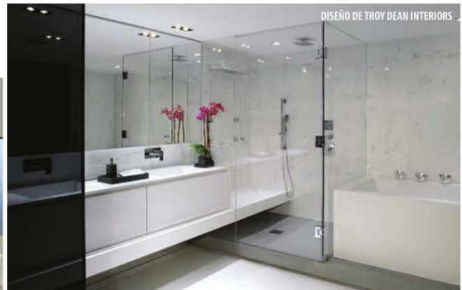
DISEÑO DE TROY DEAN INTERIORS

Los diseñadores animan a dejar de pensarlo y atreverse a tomar la decisión de hacerlo, contratar a un buen diseñador, confiar en las sugerencias para que la satisfacción sea parte de su día a día en casa.